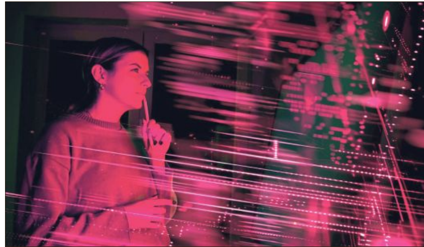
Arbeitet man im Job mit KI-Tools, gibt es diverse Regeln zu beachten.

„Wenn Unternehmen KI einsetzen, müssen die Mitarbeiter entsprechend geschult sein“, sagt