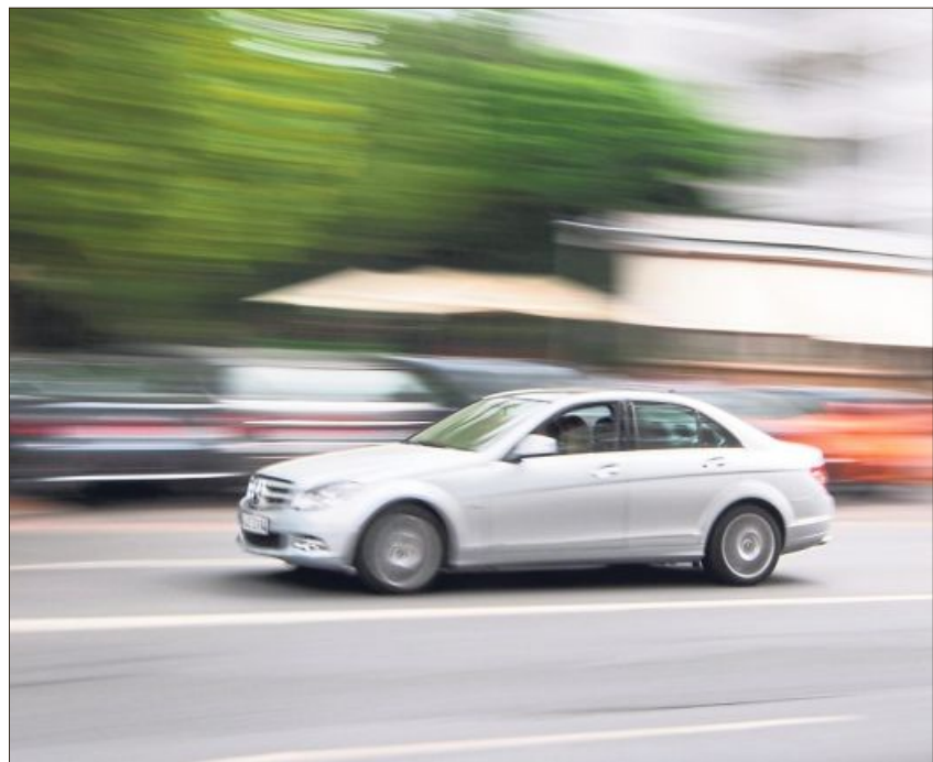
Sicherheitsrisiko: Im Sommer verschlechtern sich die Fahreigenschaften von Winterreifen erheblich.

Redaktion Auto & Mobilität: Anna-Lena Wagner annalena.wagner@mga.de