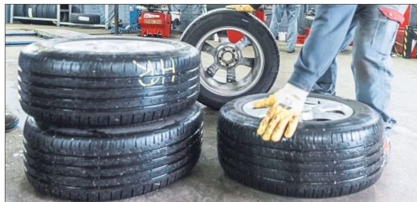
Frisch ist sicherer: Reifen sollten beim Kauf nicht zu alt sein, auch wenn sie unbenutzt sind.

Vor allem bei hohem Tempo oder heißem Asphalt sind Winterreifen gefährlich. Der Reifen wird zu warm und stark in seiner Leistungsfähigkeit eingeschränkt. Außerdem sollten auch hohe Beladungen vermieden werden – denn das sorgt für nicht ausreichende Haftung. Zudem kann es nach Unfällen im Einzelfall auch Probleme mit Versicherungen geben, wenn diese beispielsweise eine falsche Bereifung für zu lange Bremswege anführt, sagt der ADAC.