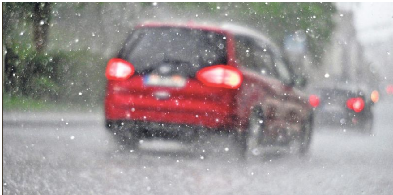
Vorsicht unterwegs: bei Hagel Tempo drosseln und Warnblinker nutzen.

Wer das nicht schafft, kann sein Auto mit Abdeckungen schützen. Dazu gibt es im Fachhandel Hagelschutzmatten, die von rund 50 bis 300 Euro kosten. Der ADAC rät, darauf zu achten, dass sich solche Matten sicher und fest anbringen lassen.