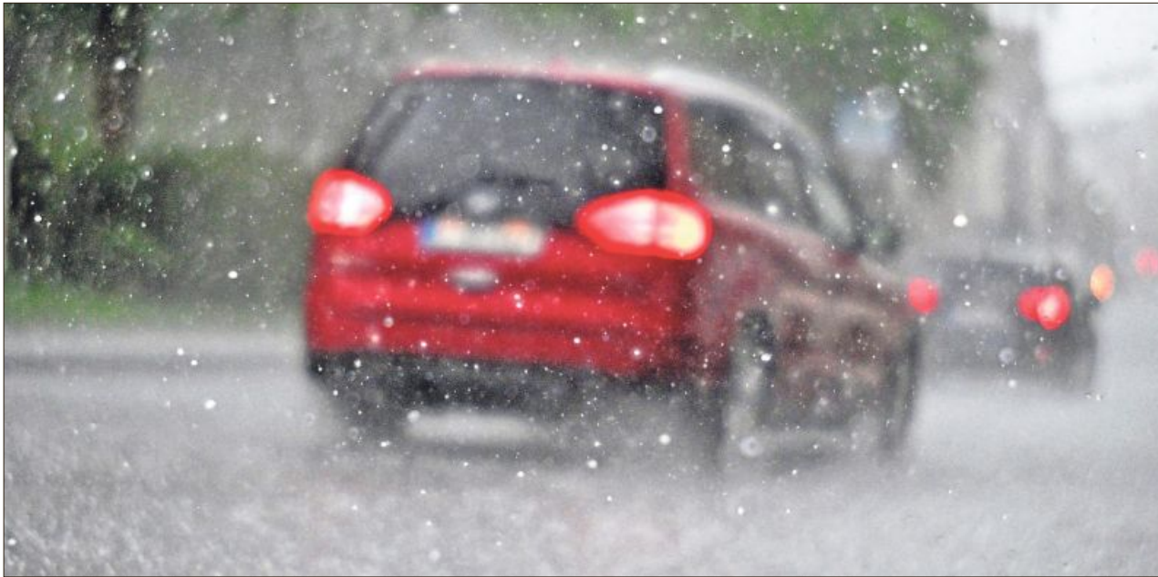
Vorsicht unterwegs: bei Hagel Tempo drosseln und Warnblinker nutzen.

Wer das nicht schafft, kann sein Auto mit Abdeckungen schützen. Dazu gibt es im Fachhandel Hagelschutzmatten, die von rund 50 bis 300 Euro kosten. Der ADAC rät, darauf zu achten, dass sich solche Matten sicher und fest anbringen lassen.