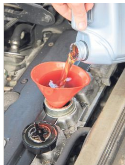
Motoröl sorgt dafür, dass der Motor des eigenen Autos einwandfrei funktioniert.

Wie oft das Öl gewechselt werden muss, ist in der Regel im Bordbuch nachzulesen. Der fällige Zeitpunkt lässt sich an den Werkstattunterlagen, unter Umständen an einem von der Werkstatt hinterlassenen Zettel im Motorraum oder im Bordcomputer feststellen.