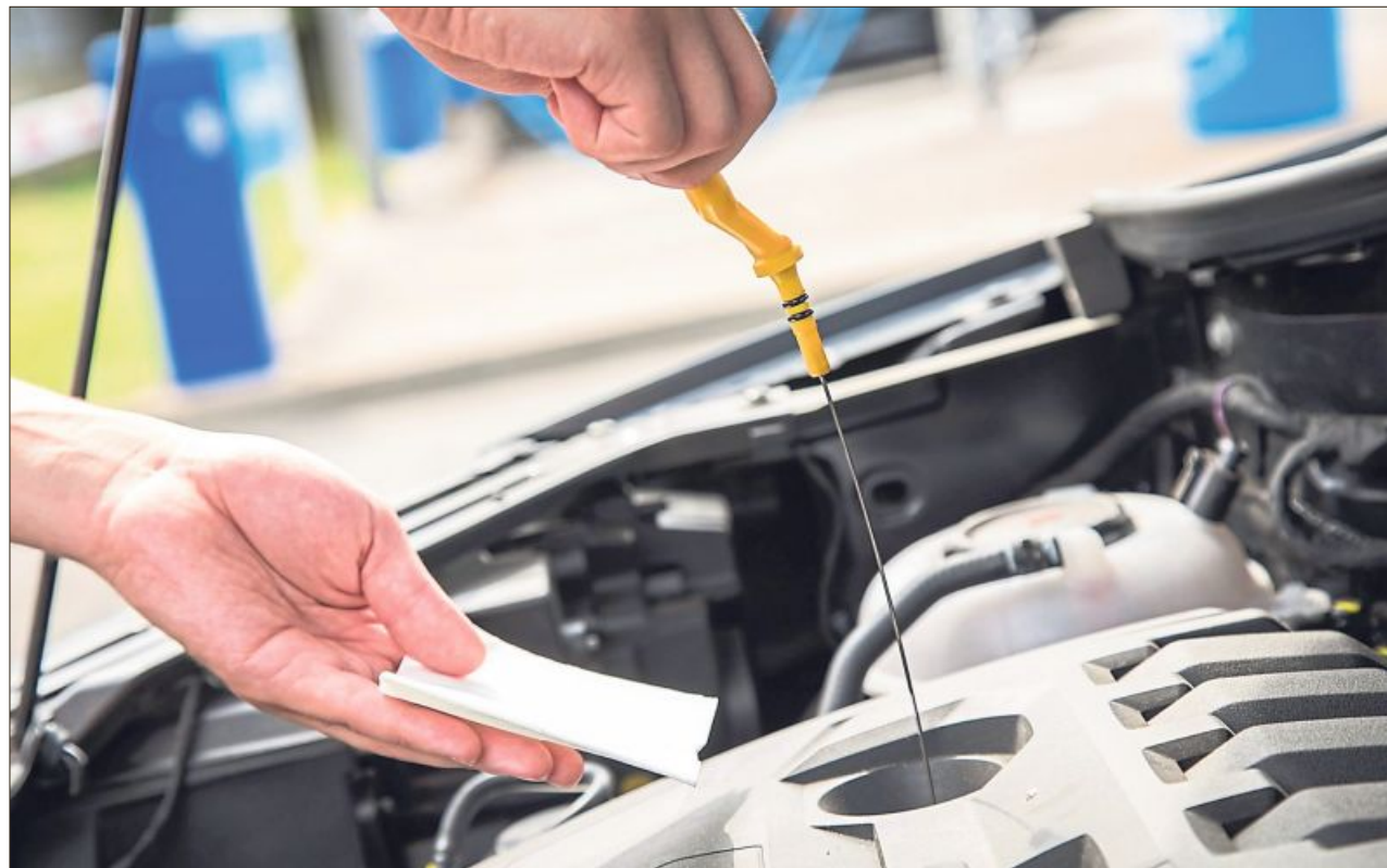
Die regelmäßige Kontrolle des Ölstands alle 1.000 Kilometer kann vor Motorschäden schützen.

Zur Kontrolle sollte man das Auto zunächst auf einer ebenen Fläche abstellen. Dann den Motor abschalten und ein bis zwei Minuten abkühlen lassen – bei betriebswarmem Öl den Stand messen, sofern die Bedienungsanleitung nichts anderes vorgibt. Bei manchen Modellen kann man länger warten müssen, bei anderen soll man sofort