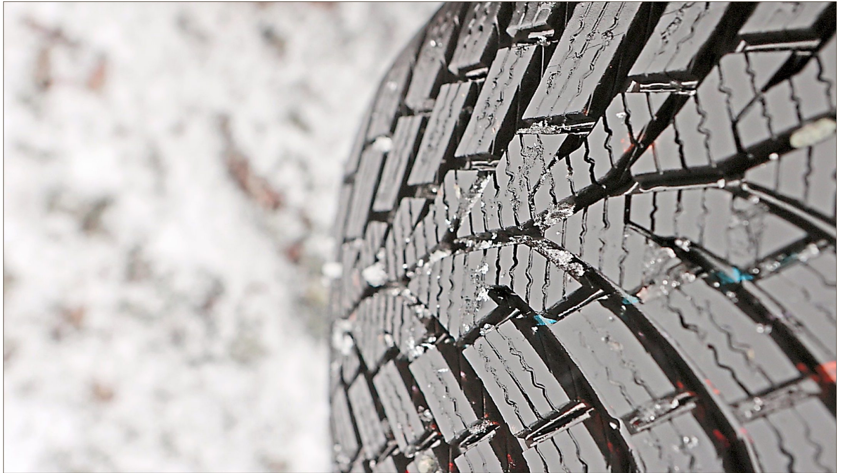
Für mehr Sicherheit: Winterreifen sollten mindestens vier Millimeter Restprofil haben.

Das Alter von Reifen lässt sich in der Regel anhand einer vierstelligen Ziffernfolge am Ende der sogenannten DOT-Nummer auf der Reifenflanke ableiten. Diese setzt sich aus der Kalenderwoche und dem Produktionsjahr zusammen. „3025“ zum Beispiel bedeutet dann, dass der Reifen in der 30. Kalenderwoche des Jahres 2025 hergestellt wurde.