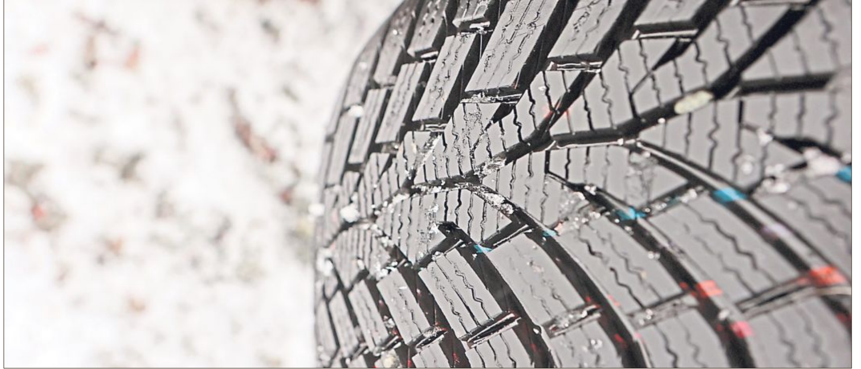
Für mehr Sicherheit: Winterreifen sollten mindestens vier Millimeter Restprofil haben.

Das Alter von Reifen lässt sich in der Regel anhand einer vierstelligen Ziffernfolge am Ende der sogenannten DOT-Nummer auf der Reifen-