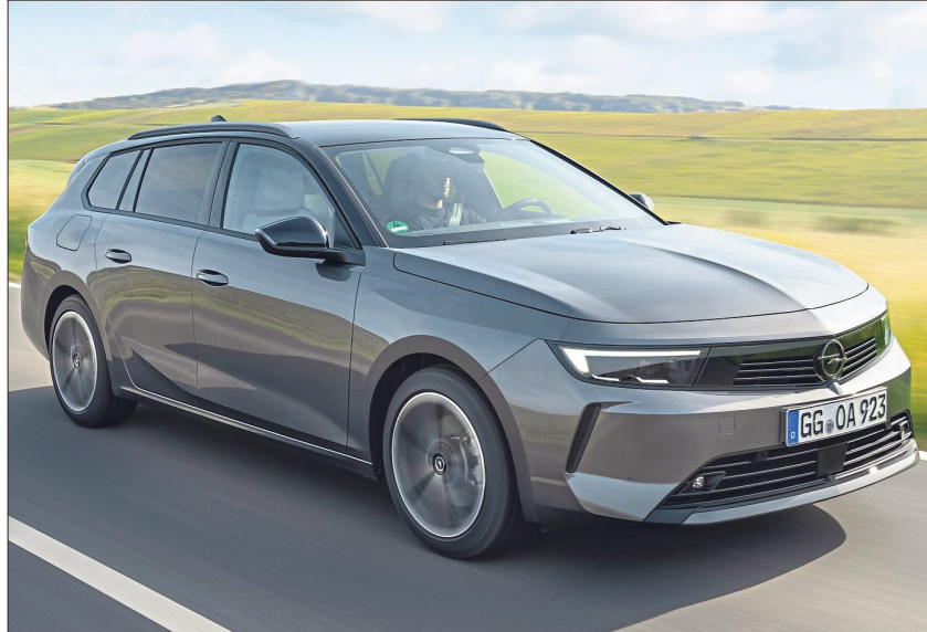
Der Astra Sports Tourer bietet allerlei High-Tech-Ausstattung.

Den Astra Sports Tourer aufs Hinterteil zu reduzieren, wird dem Kombi allerdings nicht gerecht. Auch die Passagierkabine ist auf Verweil-Komfort getrimmt, auf den hinteren Sitzen überzeugt das Mo-