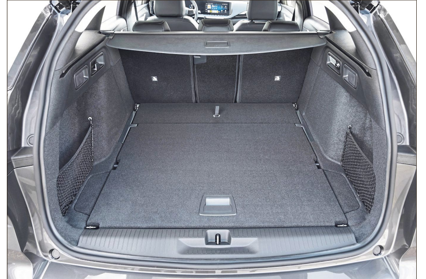
Sämtlicher Innenraum ist unter den Prämissen der Funktionalität ausgelegt.

dell mit Kopffreiheit und Platz zuhauf auch für Menschen mit großer Statur. Ausgestaltet ist der Innenraum unter den Prämissen der Funktionalität, ohne dabei der im Segment zu erwartenden Wertigkeit verlustig zu gehen – unspektakulär, aber keineswegs langweilig. Dasselbe gilt im Übrigen für die Außen-Wahrnehmung, bei der der kurze vordere Karosserie-Überhang ins Auge sticht.