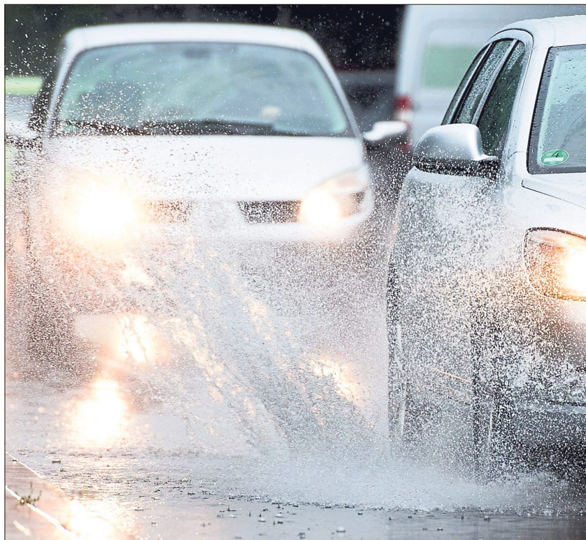
Bei starkem Regen kann es zu Aquaplaning kommen.

Auch bei starkem Wind ist gedrosseltes Tempo das Wichtigste. Denn je langsamer das Auto fährt, desto besser lässt sich am Lenkrad