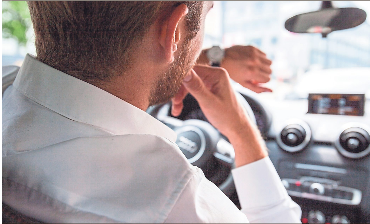
Auch wenn die Zeit drängt: Ohne Stress und Aggressionen fährt es sich sicherer.