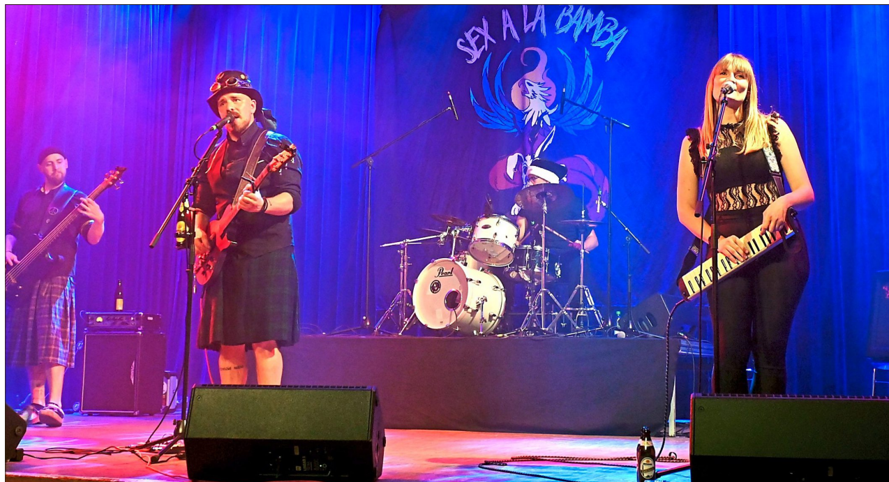
250 Gäste feierten zusammen beim Auftritt von Sex à la Bamba.