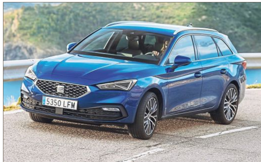
Mit viel Fahrspaß und geringem Spritverbrauch weiß der Seat Leon Sportstourer im Test zu überzeugen.

Den eingangs thematisierten sportlichen Auftritt des Sportstourer unterstreichen der kernige Sound des mit einem 150 PS (110 kW) Zwei-Liter-Aggregat bestückten Selbstzünders, dessen Antrittsqualitäten und nicht zuletzt Bodenhaftung und Wendigkeit des serienmäßig mit 18-Zoll-Leichtmetallrädern der Größe 225/40 ausgestatte-