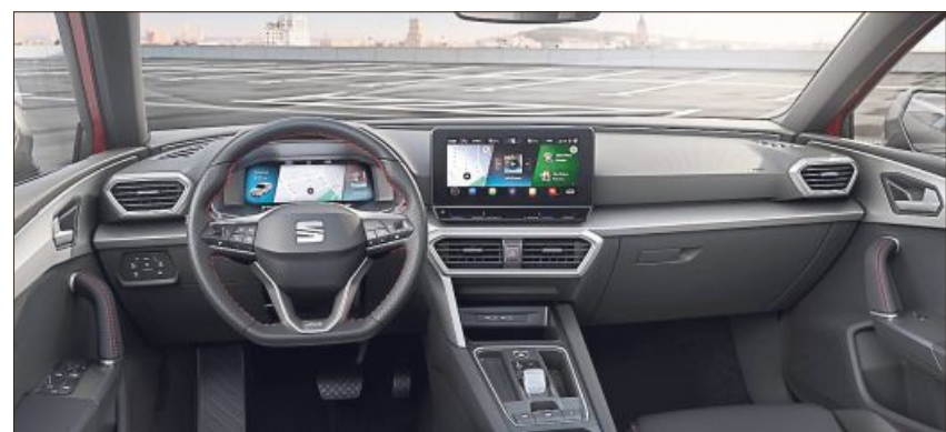
Komfort und Technologie vereint: Das individualisierbare Digital-Cockpit des Seat Leon Sportstourer.

Auto Hinweise an unsere Leser und Inserenten: Zur Vermeidung von Verwechslungen mit privaten Anzeigen müssen gewerbliche Anzeigen als solche klar erkennbar sein, z. B. durch Kennzeichnung mit „Kfz-Firma“ bzw. „Firma“ für sonstige gewerbliche Anbieter. Der Gebrauch von Kennzeichnungen geschieht in Verantwortung und auf Risiko des Auftraggebers. Mediengruppe Attenkofer