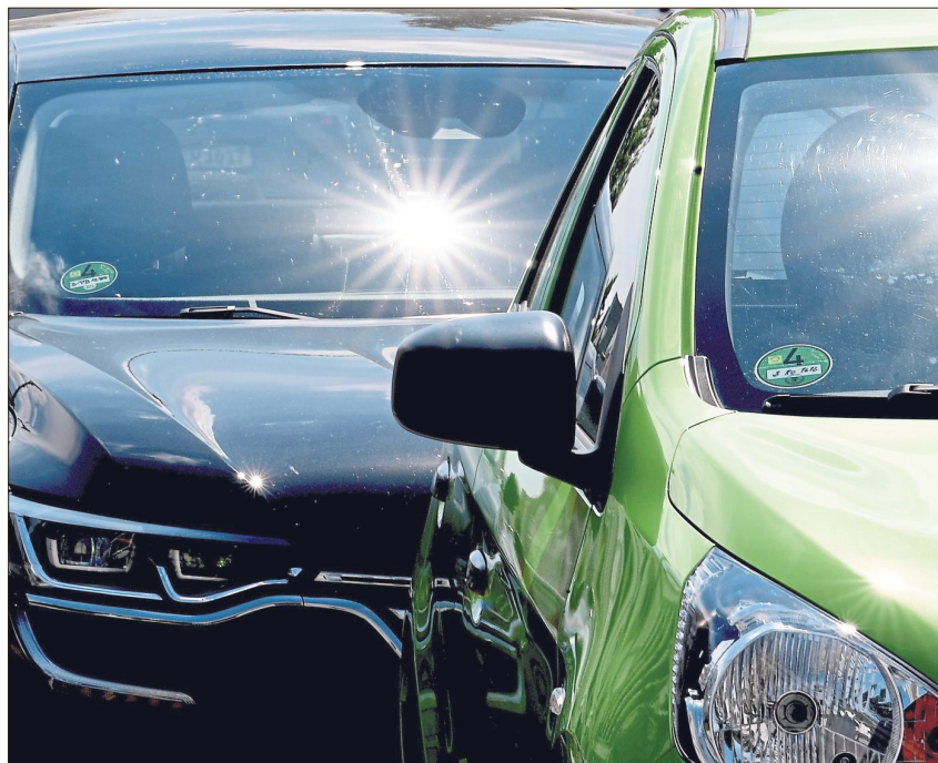
Die Sonne knallt: Ein im Sommer abgestelltes Auto wird schnell zum Backofen.

Auch im Stand kann es für die Insassen schnell gefährlich werden. Daher sollte man bei sommerlichen Temperaturen Kinder und Tiere niemals, und auch nicht „nur ganz kurz“, im Auto zurücklassen. Auch leicht geöffnete Scheiben machen kaum einen Unterschied, wie ein Testversuch des ADAC zeigte: